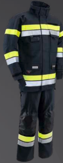
Nomex® NXT Dunkelblau 203