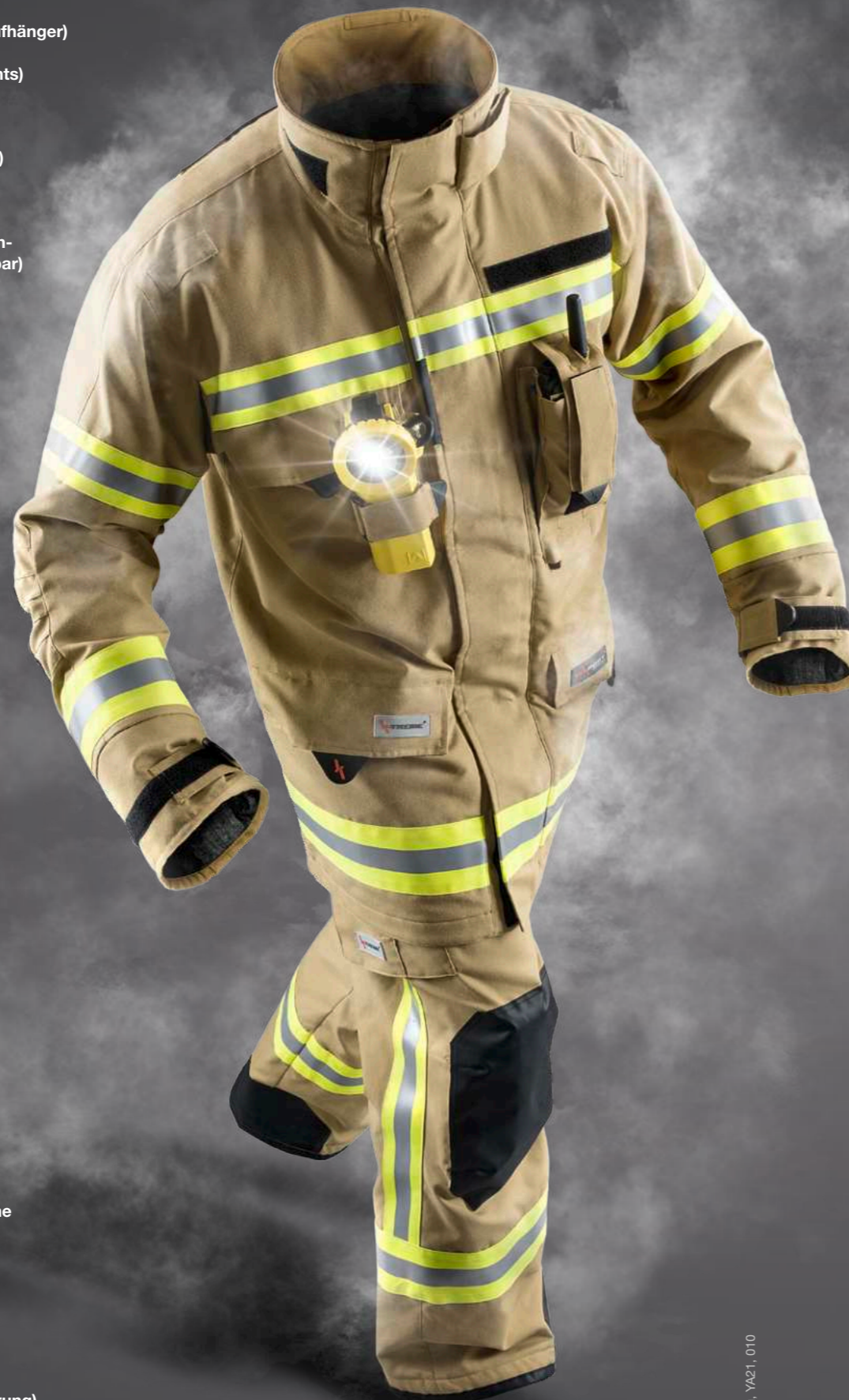
Abb. Fire KS04 Salzburg, YA21, 010