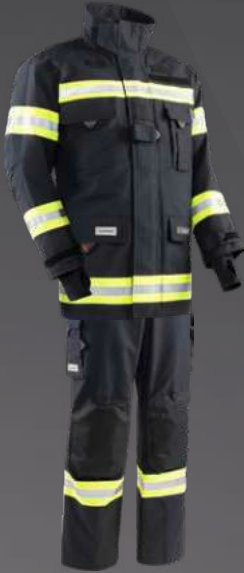
Nomex® NXT Dunkelblau 203

OBERÖSTERREICH / BURGENLAND / VORARLBERG / NIEDERÖSTERREICH