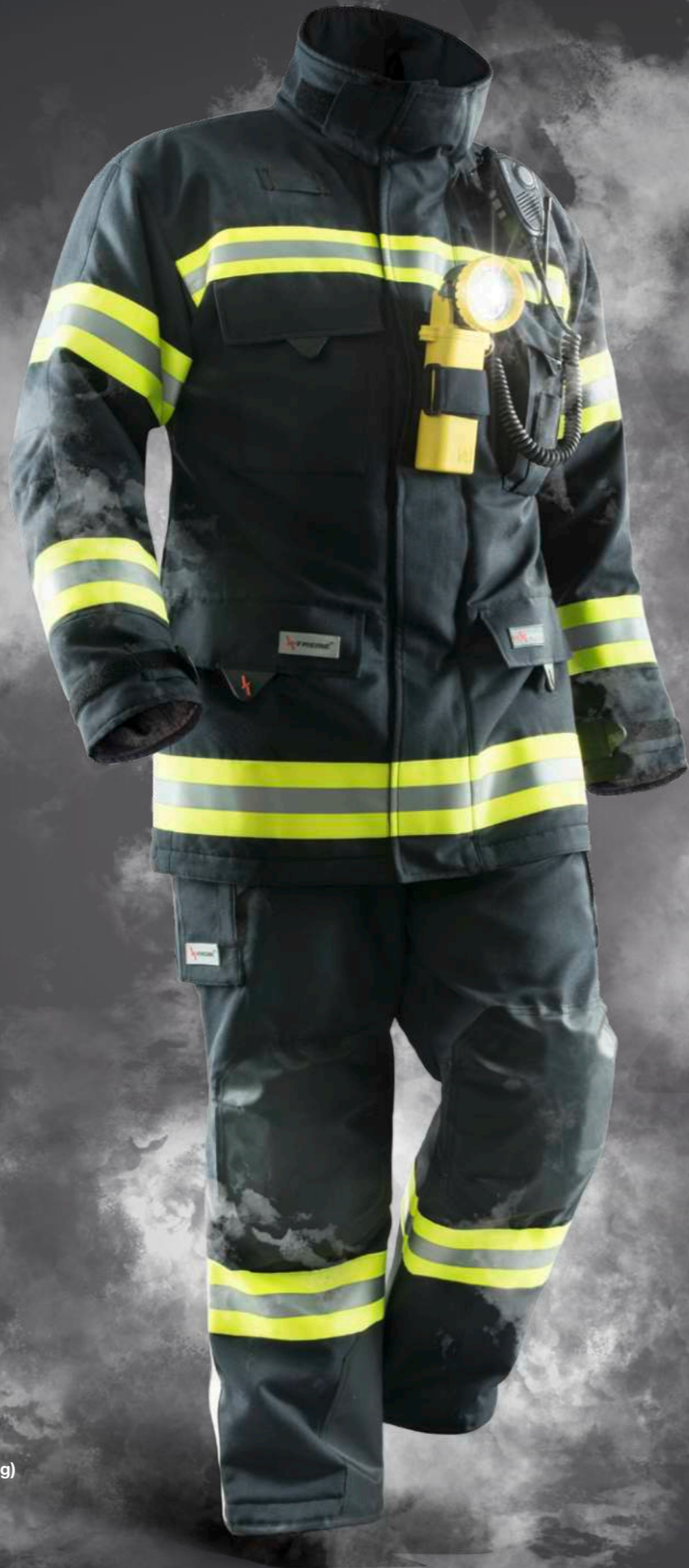
Abb. Fire KS04 Jacke OÖ/BGL, ZA16, 203 und Fire KS04 Hose OÖ/BGL/Städtiro II, YA16, 203