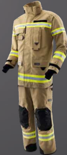
Nomex® NXT Gold 010

TEXPORT Handelsgesellschaft m.b.H. Franz-Sauer-Straße 30 5020 Salzburg, AUSTRIA