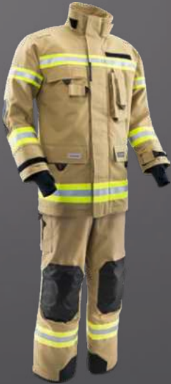
Nomex® NXT Gold 010