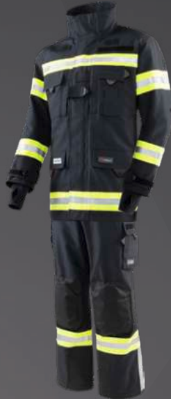
Nomex® NXT Dunkelblau 203