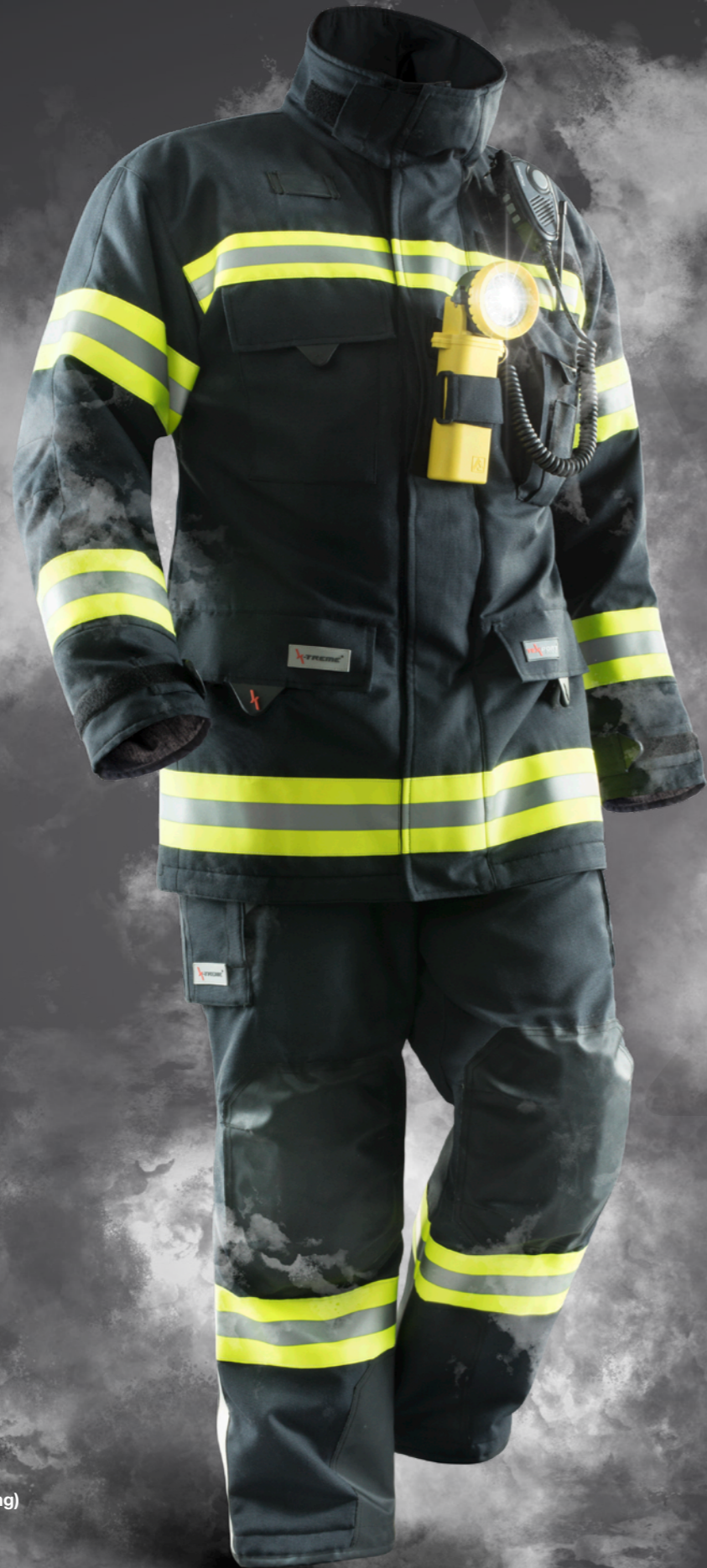
Abb. FIRE KS04-Jacke OÖ/BGL, ZA 16, 203 und FIRE KS04-Hose OÖ/BGL/SÜDTIROL, II, YA16, 203