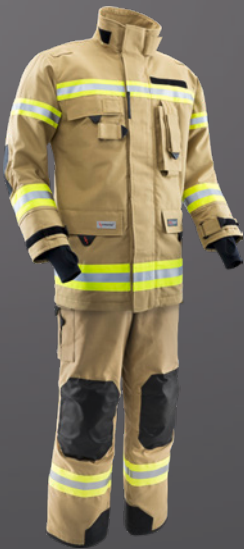
Nomex® NXT Gold 010