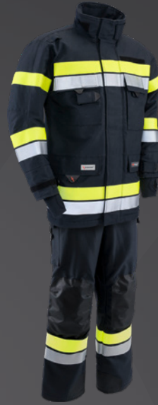
Nomex® NXT Dunkelblau 203