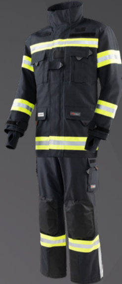
Nomex® NXT Dunkelblau 203