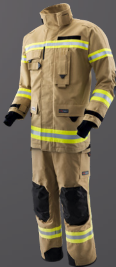
Nomex® NXT Gold 010

TEXPORT Handelsgesellschaft m.b.H. Franz-Sauer-Straße 30 5020 Salzburg, AUSTRIA ☎ +43 (0)662 423 244 📠 +43 (0)662 423 243 ✉ office@texport.at 🌐 texport.at