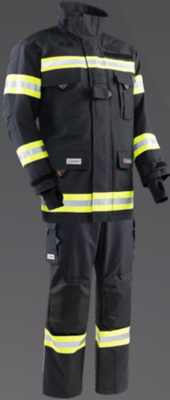
Nomex® NXT Dunkelblau 203

OBERÖSTERREICH / BURGENLAND / VORARLBERG / NIEDERÖSTERREICH