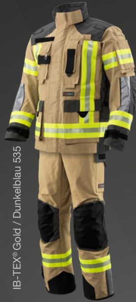
IB-TEX® Gold / Dunkelblau 535