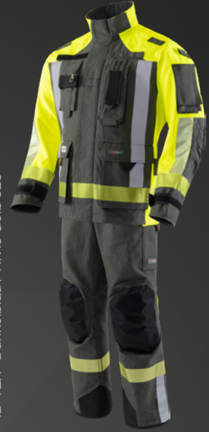
IB-TEX® Dunkelblau / HiVis Gelb 523