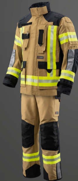
Nomex® NXT Gold / Dunkelblau 535