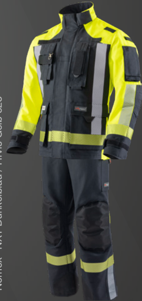
Nomex® NXT Dunkelblau / HiVis Gelb 523

Stand: Herbst 2022 | Satz- und Druckfehler sowie Änderungen vorbehalten. Aufgrund drucktechnischer Gegebenheiten können Farbabweichungen zwischen den Darstellungen im Katalog und den Original-Produkten auftreten.