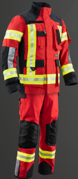
Nomex® NXT Rot / Dunkelblau 539