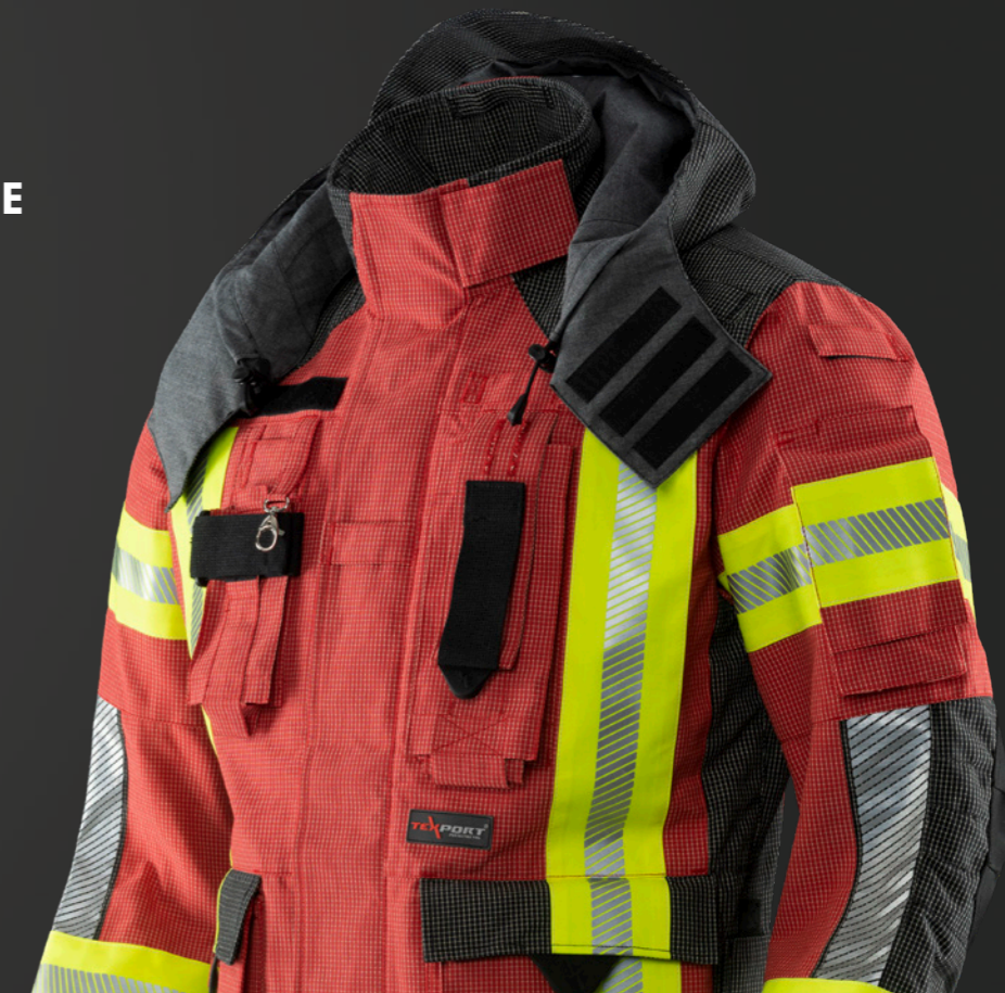
Abb. Guardian RSQ Jacke, PA06, 539 mit Kapuze, PA06, 203