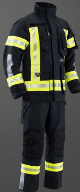
Nomex® NXT Dunkelblau / Dunkelblau 502