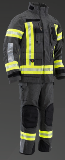
IB-TEX® Dunkelblau / Dunkelblau 502