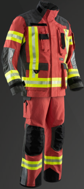
IB-TEX® Rot / Dunkelblau 539