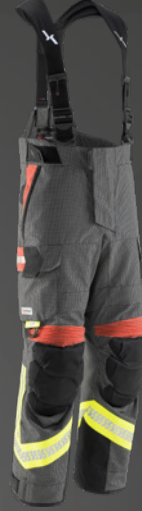
FIRE X-FLASH IB-TEX® Dunkelblau / Gold 542