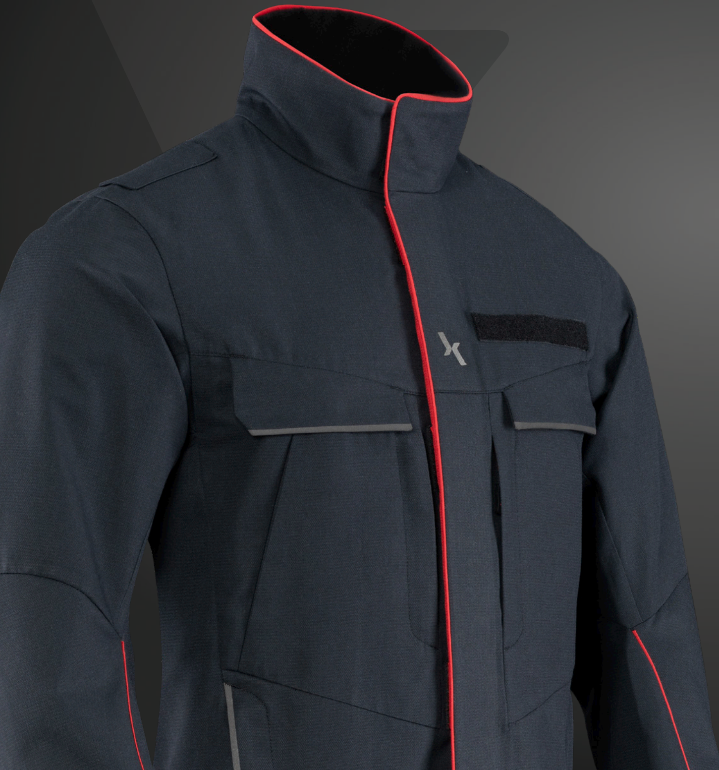
Abb. X-PULSATE FR Jacke, RA39, 204

Das neue Gewebe (Nomex® / Viskose) besticht mit guten mechanischen Werten und leichtem Gewicht. Das Gewebe ist auch nach vielen Wäschen noch farbecht und bietet eine hervorragende Waschbeständigkeit.