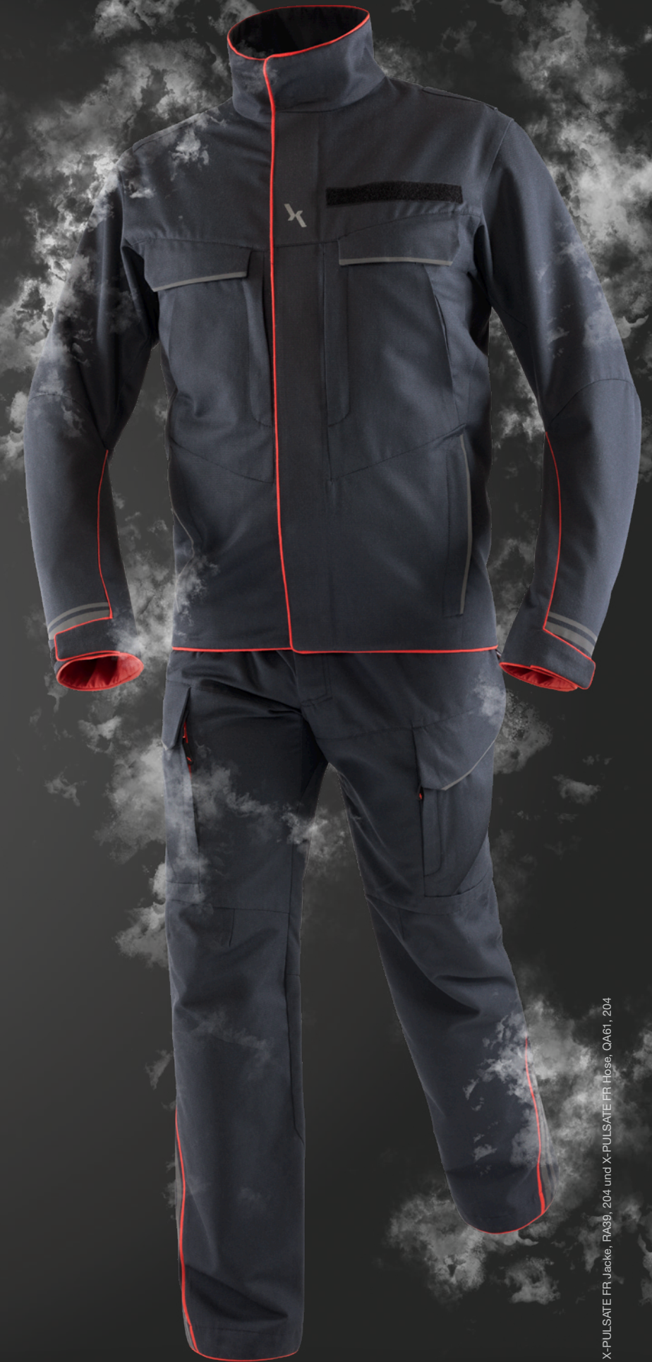
Abb. X-PULSATE FR Jacke, RA39, 204 und X-PULSATE FR Hose, QA61, 204

SOWIE IN EINFARBIGER VARIANTE (OHNE ROTE FARBKZENTE)