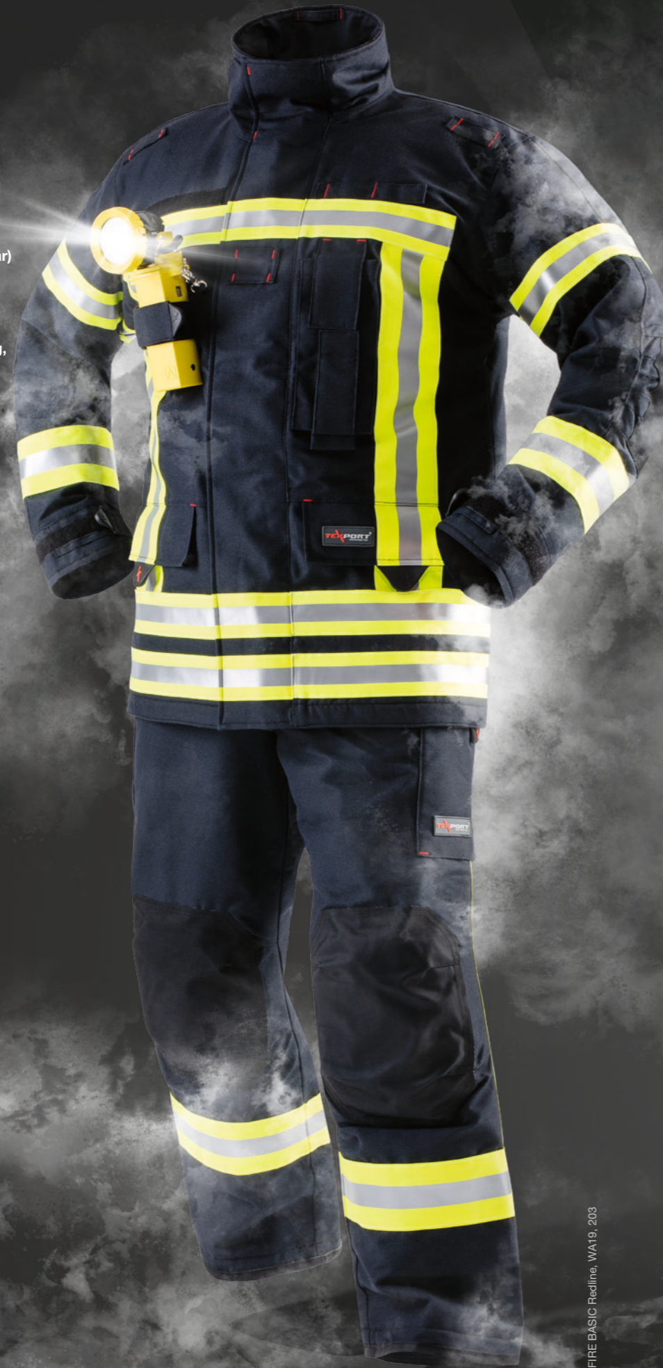
Abb. FIRE BASIC Redline, WA19, 203