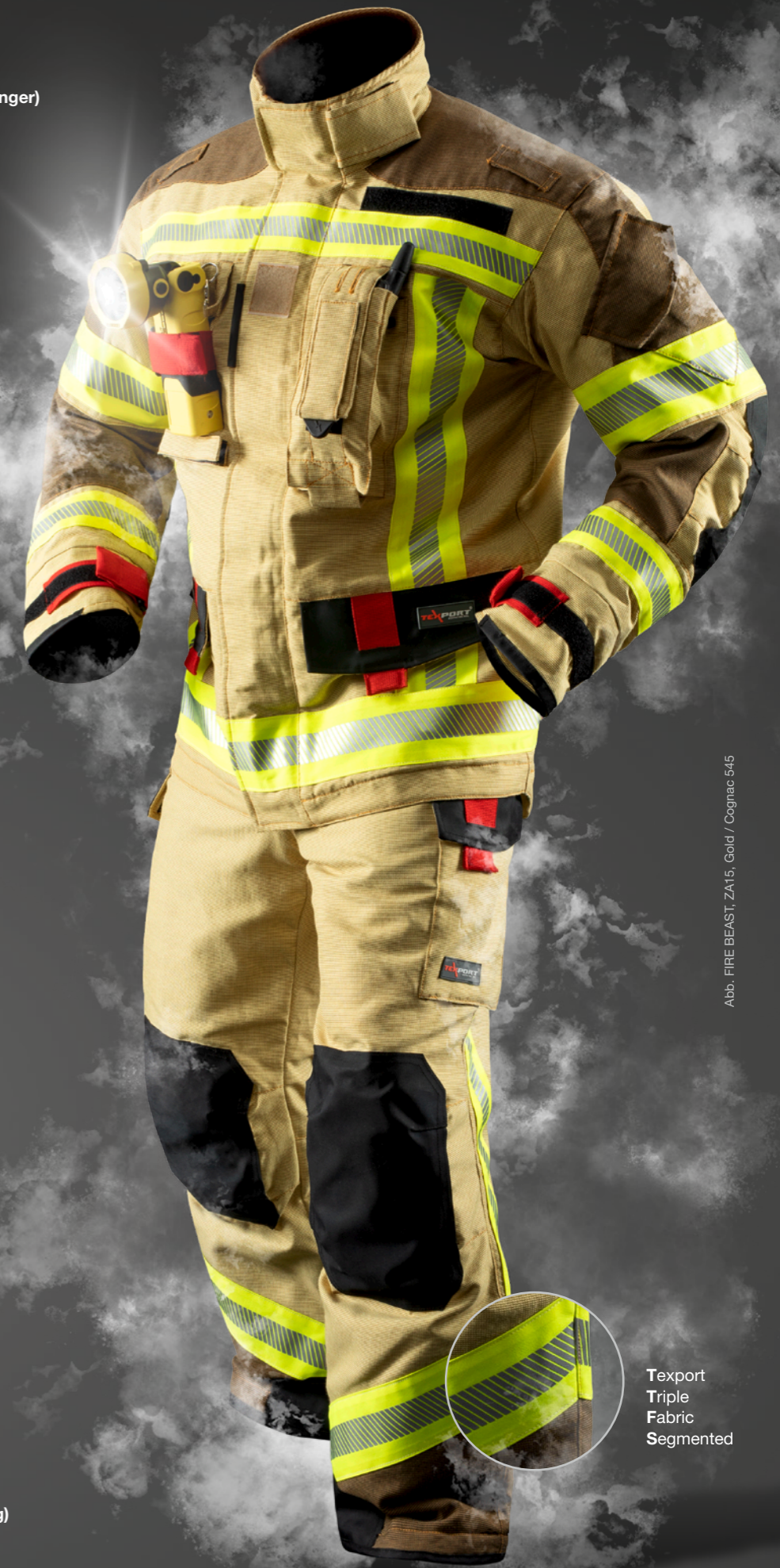
Abb. FIRE BEAST, ZA15, Gold / Cognac 545

▷ Beinabschluss hinten (Fersenaussparung)