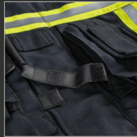
Loop-Funktionslasche Taschenöffnung und Karabinerentnahme