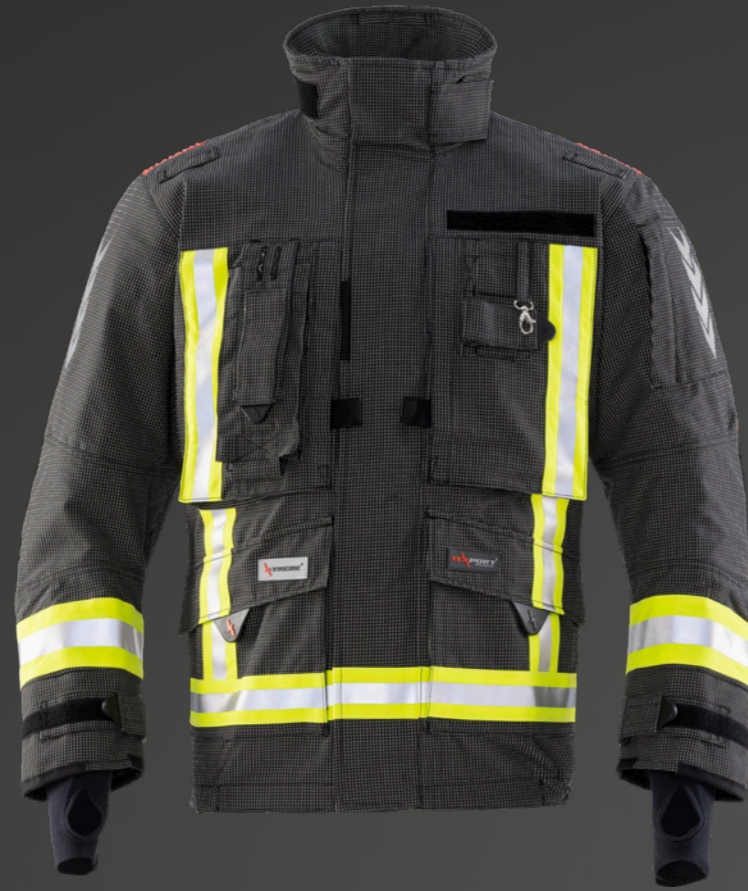
Abb. FIRE STRETCH Jacke, YA14, 203

Die verschiedenen Gurtsysteme zeichnen sich durch Hitzeschutz, Tragekomfort und eine einfache Handhabung aus. Dank umfangreichem Zubehör besteht außerdem die Möglichkeit, die Systeme individuell zusammenzustellen und dadurch den verschiedensten Ansprüchen einer Feuerwehr gerecht zu werden. Ein weiterer Vorteil ist, dass der Haltegurt/Rettungsschleife durch die durchdachte Konstruktion sehr leicht ein- und wieder ausgefädelt werden kann. Somit werden die ordnungsgemäße Inspektion, die Wartung und die fachgerechte Reinigung der Jacke erleichtert.